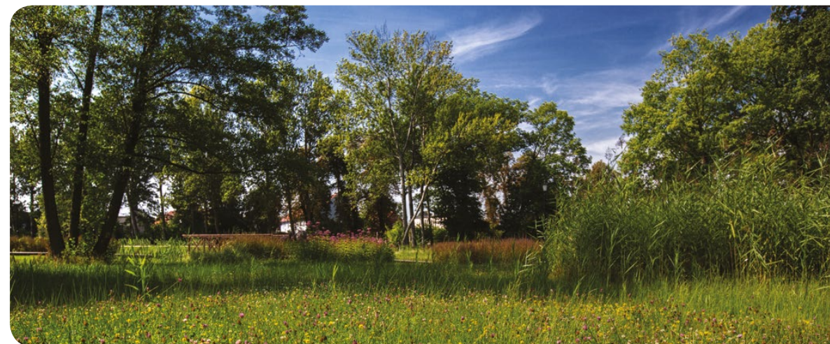
Taki trawnik na pewno sprzyja bioróżnorodności

W obecnej sytuacji intensyfikacji i chemizacji rolnictwa pszczoły paradoksalnie znajdują lepsze warunki do życia w mieście niż na terenach rolniczych. Zielone tereny miejskie, takie jak ogrody botaniczne, gromadzą na stosunkowo małej powierzchni dużą liczbę kwitnących roślin, co stanowi oazę dla poszukujących pożywienia pszczoł. Tutaj także nie stosuje się na dużą skalę środków ochrony roślin, co umożliwia pszczołom bezpieczną egzystencję.