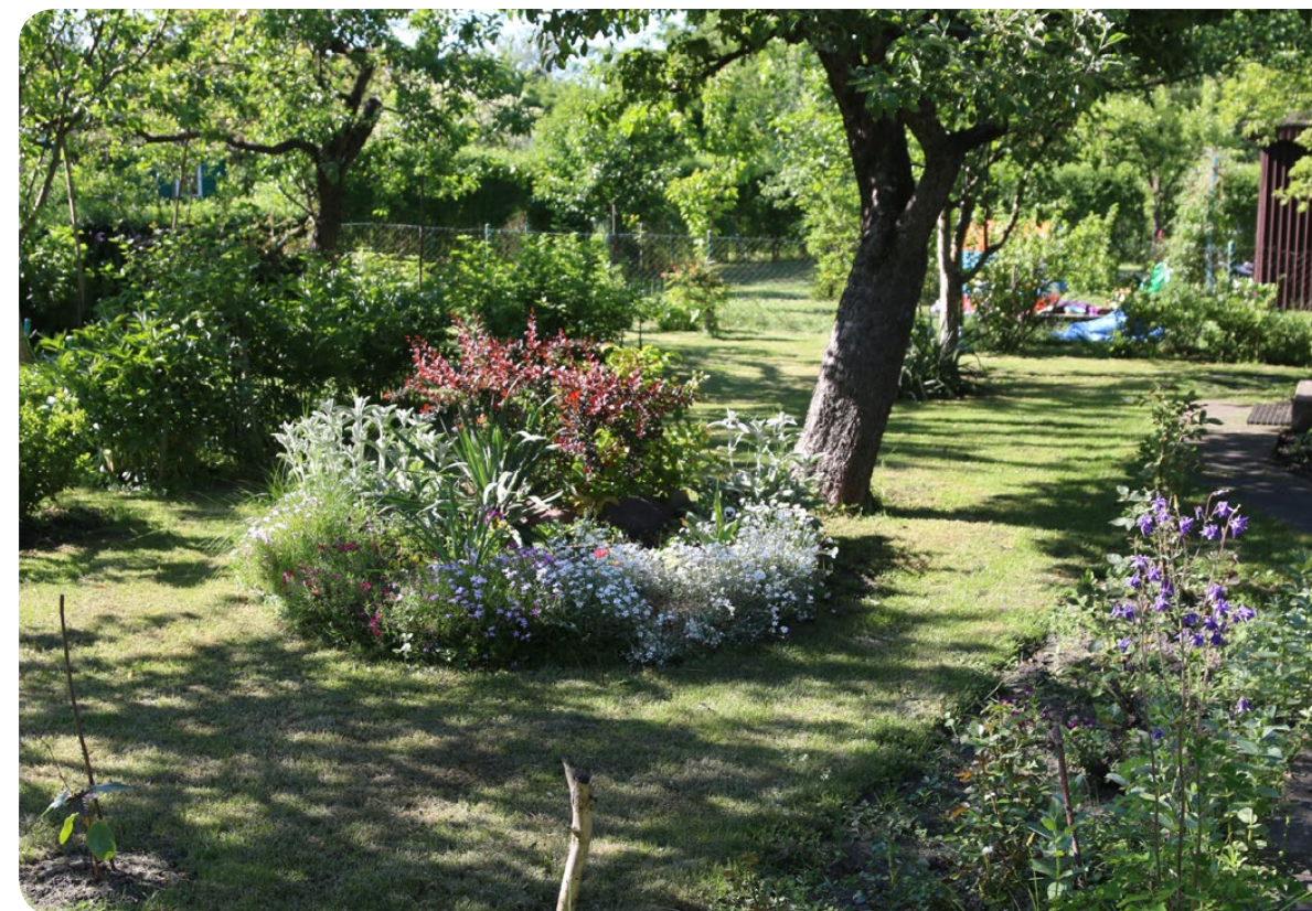
Ogródki działkowe to przestrzeń, gdzie pszczoły lubią zakładać gniazda

Aranżując kwiatne ozdobne rabaty, warto także zwrócić uwagę na dobór roślin, aby w jak największym stopniu były one przyjazne dla zapylaczy (Tabele 2, 3 i 4). Szczególnie w ogródkach działkowych i przydomowych warto zadbać o towarzystwo roślin aromatycznych, których olejki eteryczne wpływają pozytywnie na nasz nastrój, a jednocześnie odstraszaają niechciane mszki i komary. Gatunki tych roślin to także dobrzy sąsiedzi upraw warzyw i owoców, ponieważ stymulują ich wzrost i odstraszaają szkodniki. Do takich roślin niewątpliwie należą zioła. Nie zapominajmy również o ich zbawiennym wpływie na nasze zdrowie i kulinarnych właściwościach. Dodatkowo, jeśli pozwolimy tym roślinom zakwitnąć, dajemy pszczołom bardzo wartościowy pożytek (Tabela 5).