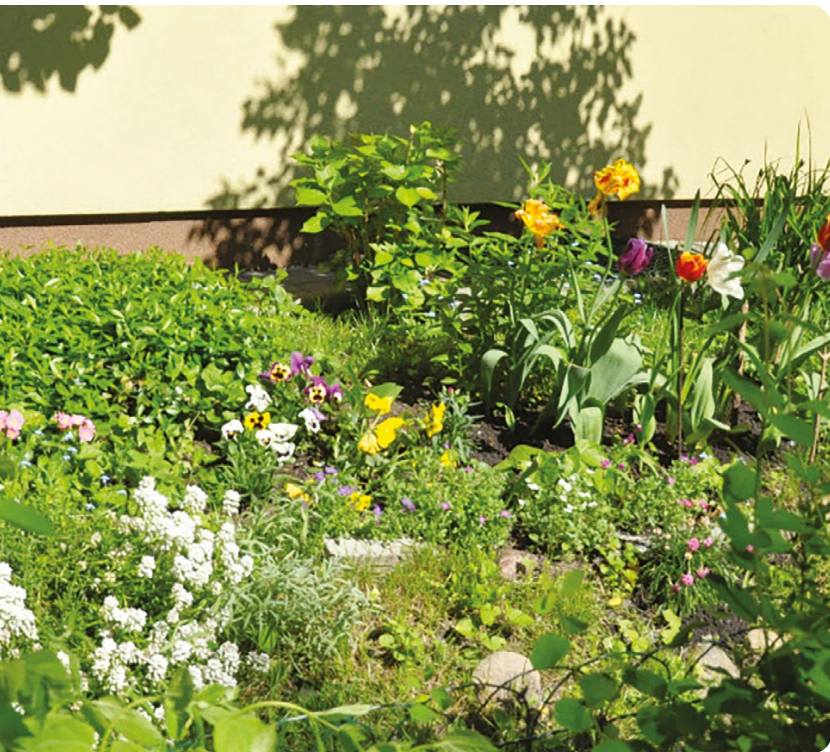
Kwiatne rabaty na osiedlach to pożytek dla owadów zapylających

Na terenach osiedli sporą przestrzeń zajmują powierzchnie trawnikowe, które można by pielęgnować w sposób analogiczny do podanego dla parków (rozdział „Polany i trawniki”). Także wzbogacanie trawników w kwitnące rośliny (Tabela 1) przyniosłoby zysk nie tylko zapylaczom, ale także estetyce osiedli. Zakładając kwiatne rabaty, również warto dodać gatunki pożytkowe dla pszczoł (Tabele 2 i 3) oraz kwitnące krzewy (Tabela 4).