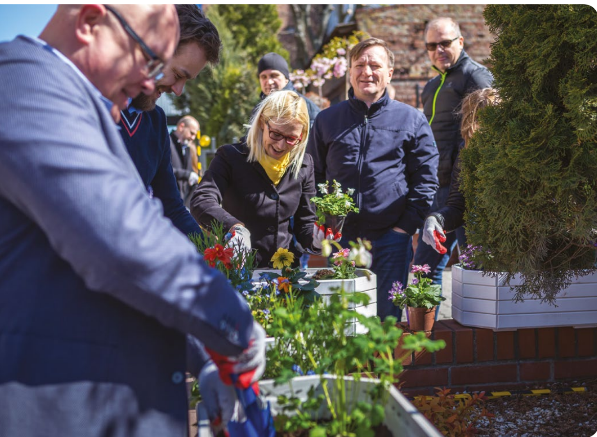
Hotel dla owadów i ogródek kwietny przy placówce opiekuńczej

Pracownicy ZT Kruszwica S.A. założyli Miejsce Przyjazne Pszczołom przy biurówce firmy