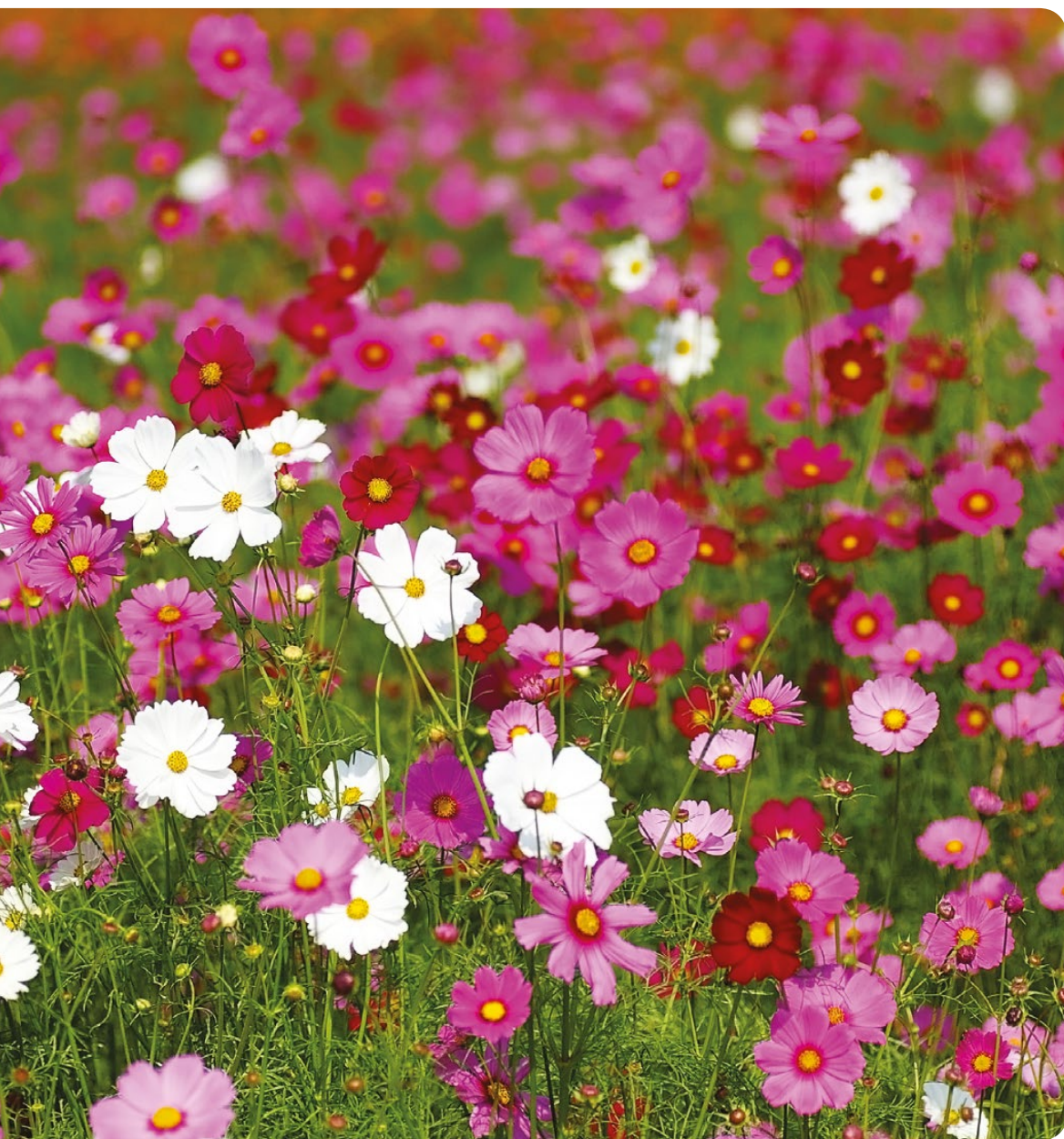
Tabela 7. Gatunki roślin ozdobnych polecane do nasadzeń na cmentarzach.