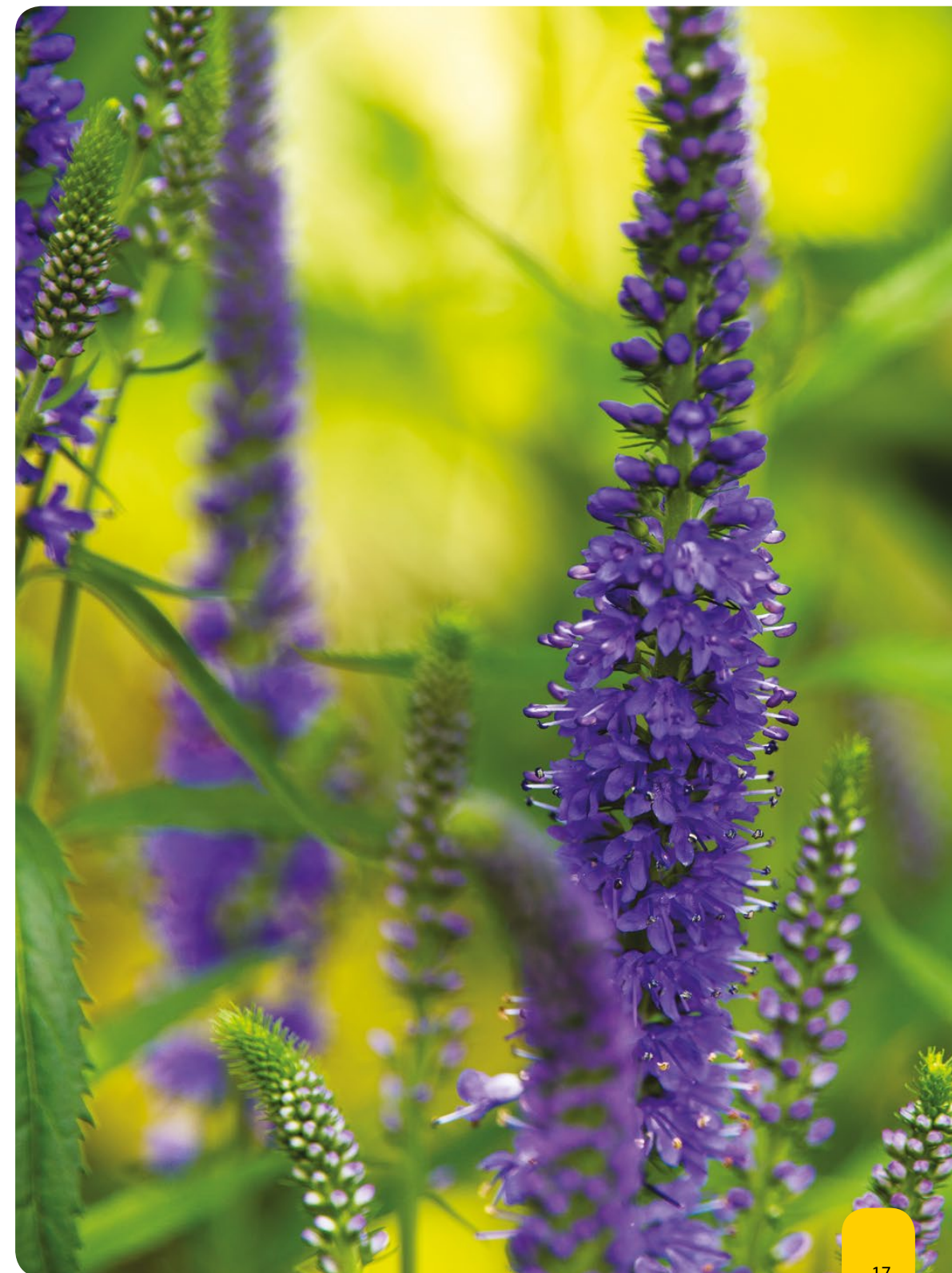
Przetacznik to roślina, która lubi nasłonecznione stanowiska

Takie gatunki jak miodunka plamista, jasnota plamista, gajowiec żółty, złoć żółta czy bodiszek żałobny sprawdzą się także jako rośliny okrywowe, tworząc kwitnące kobierce pomiędzy konarami drzew.