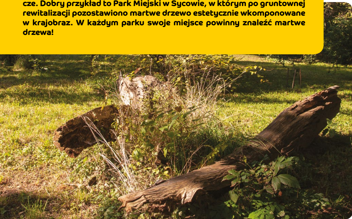
Martwe drewno powinno znaleźć swoje miejsce w każdym parku

M artwe i spróchniałe drewno jest bardzo ważnym elementem utrzymania bioróżnorodności. To w nim swoje schronienie znajdzie wiele gatunków pszczoł, a także pożyteczne i objęte ochroną prawną chrząszcze. Dobry przykład to Park Miejski w Sycowie, w którym po gruntownej rewitalizacji pozostawiono martwe drzewo estetycznie wkomponowane w krajobraz. W każdym parku swoje miejsce powinny znaleźć martwe drzewa!